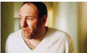
Stories of Lost Souls