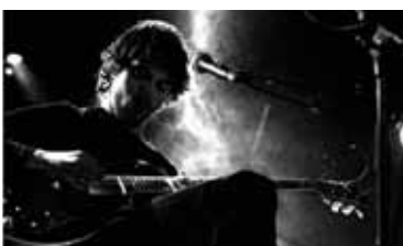
The Flying Horseman (caféconcert)