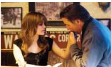
New York, I Love You