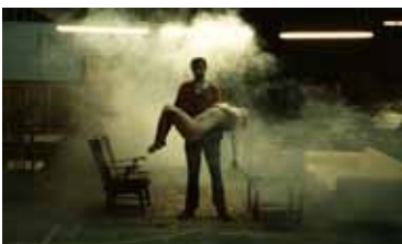
Blonde Fire (Videoclips)